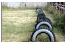
Старые автошины покроют стадионы