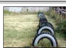
Старые автошины покрывают стадионы