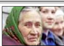
О пенсии надо думать уже сейчас