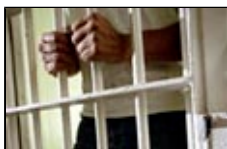
Два метра ненависти и страха