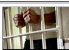
Два метра ненависти и страха