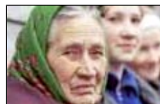
О пенсии надо думать уже сейчас